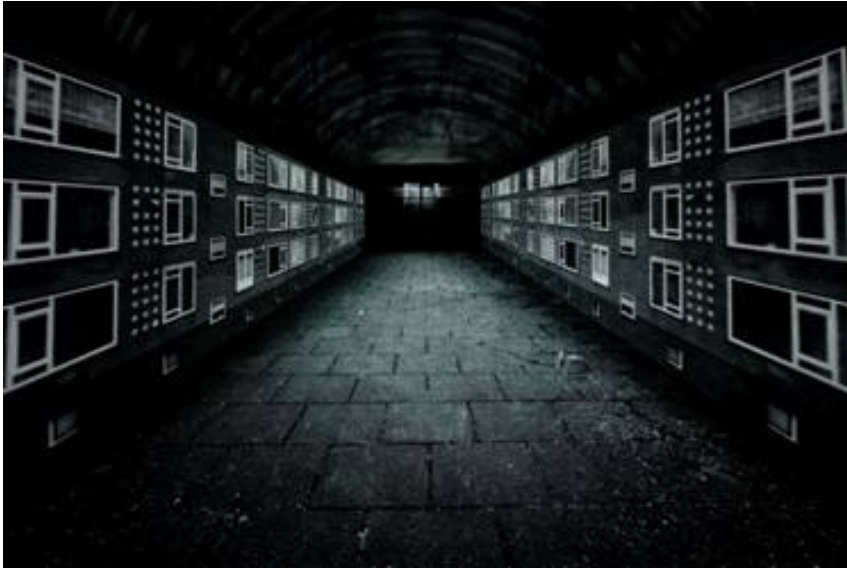
"OUTSIDE" (de clip)

Voor de videomontage is bewust gekozen voor deze foto als decor. De tunnel waarin je kan worden meegezogen.